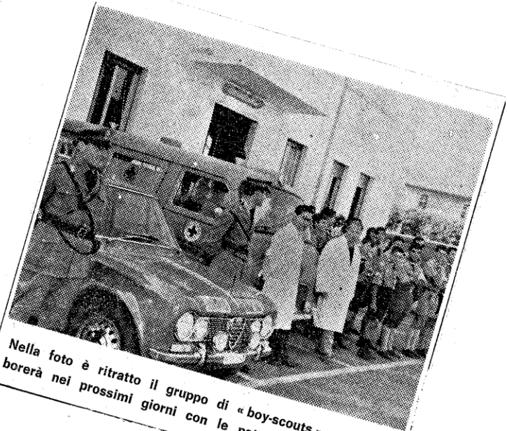
Nella foto è ritratto il gruppo di «boy-scouts» che collaborerà nei prossimi giorni con le pattuglie della stradale

sorveglieranno le statali della provincia.