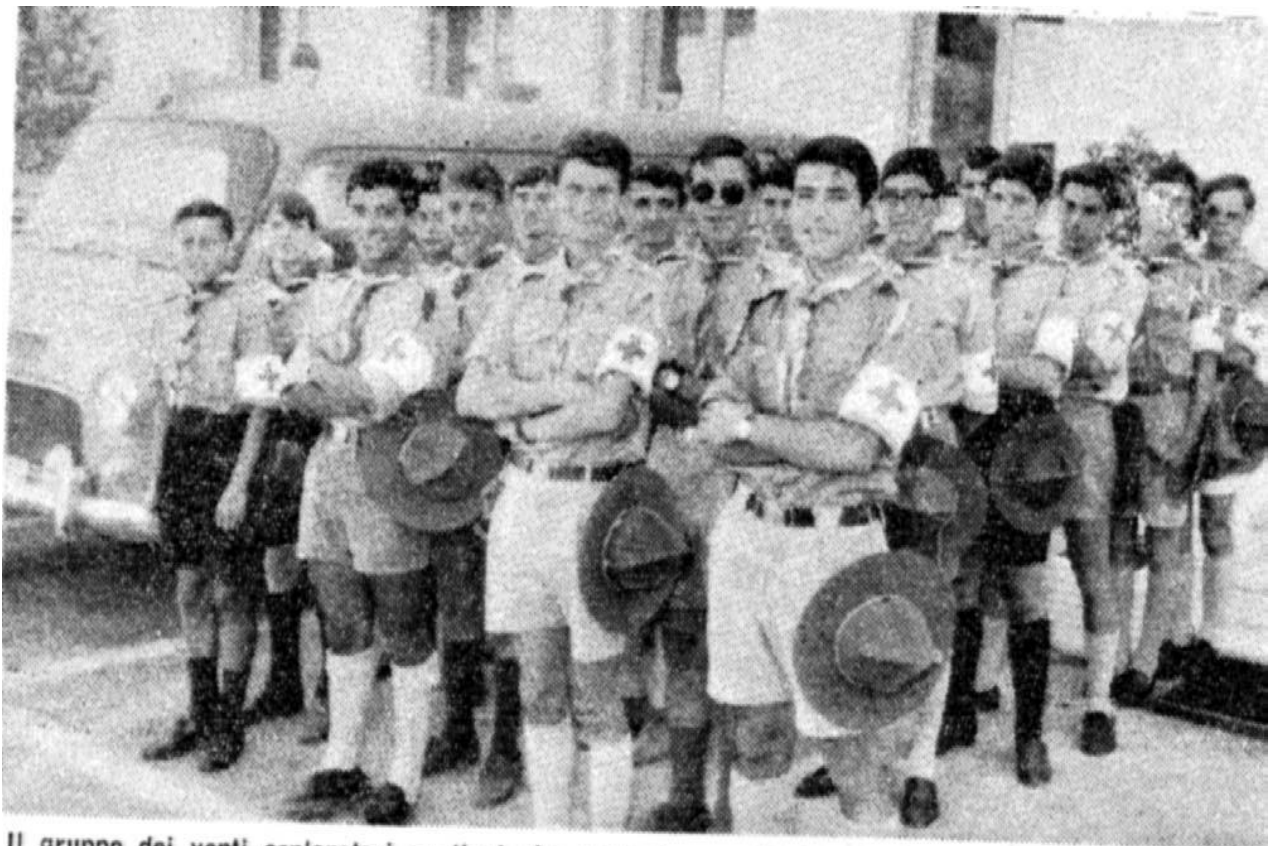
Il gruppo dei venti esploratori aquilani che partecipano all'operazione Ferragosto, collaborando con la Polizia stradale e la C.R.I.