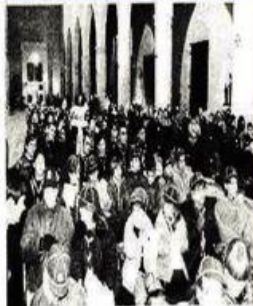
Gli scout Agesci durante la messa a Collemaggio