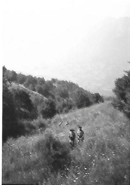
3° campo estivo "Val fondillo" Opi- PARCO NAZIONALE Il riparto AQ3 in marcia verso il lago di Scanno 15 LUGLIO 1964