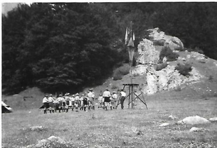
3° Campo estivo "Val fondillo" Opi-Parco Nazionale Alza Bandiera 19 luglio 1964