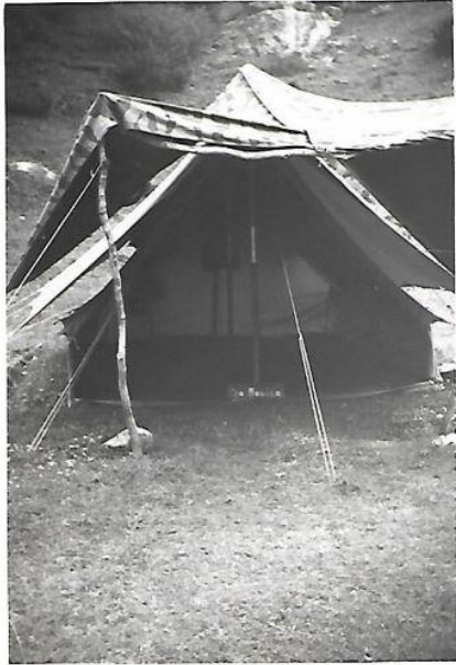
3° Campo estivo "Val Fondillo" Opi-Parco Nazionale Tenda con veranda Sq.Aquile 5 luglio 1964