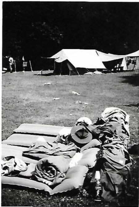
3° Campo "Val Fondillo" Materassini e coperte al sole 5 luglio 1964 Sq. Aquile