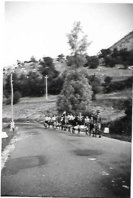
3° campo estivo "Val fondillo" Opi- PARCO NAZIONALE Il reparto AQ3 in marcia verso il lago di Scanno 15 LUGLIO 1964